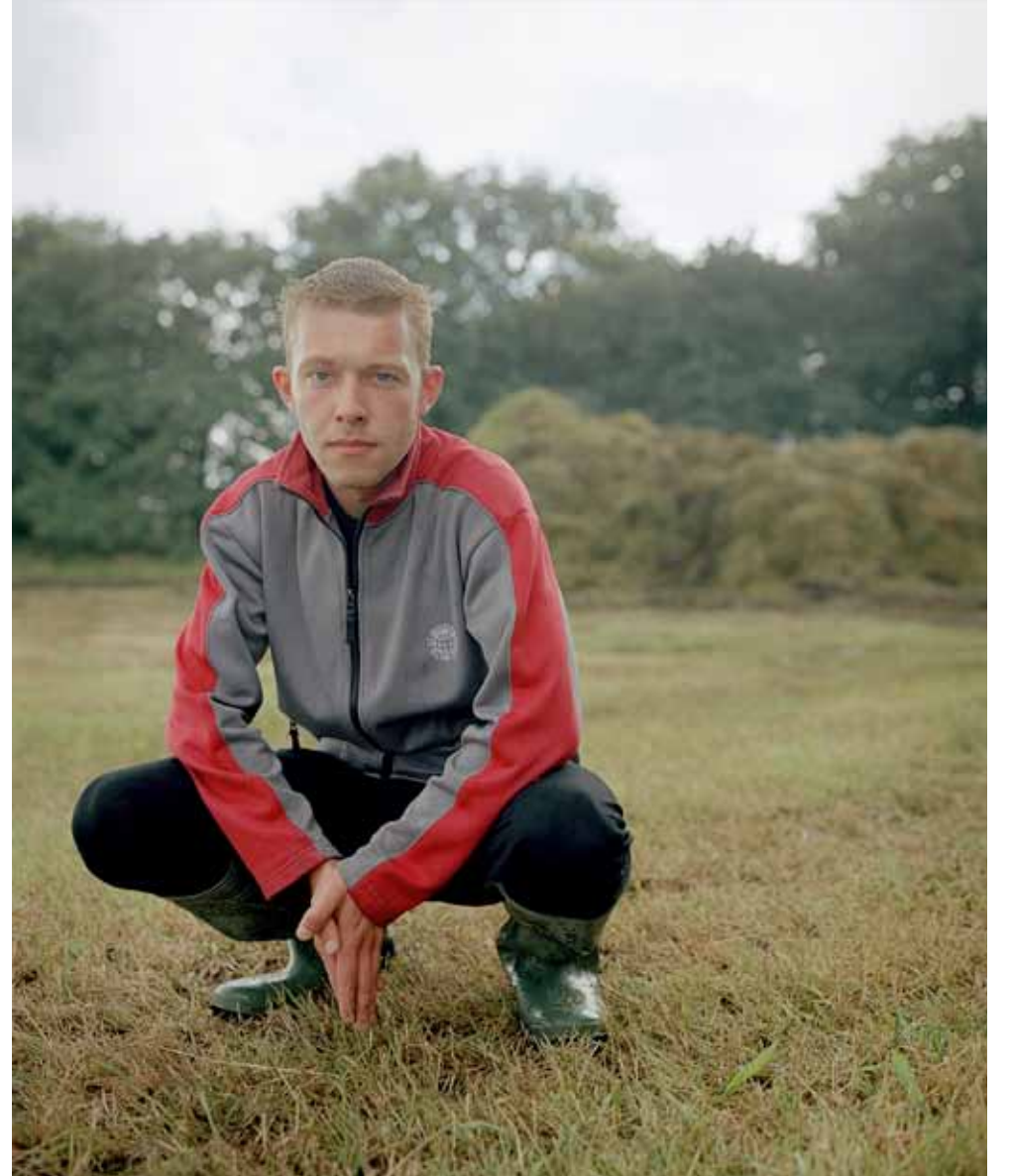
Kar Smeenge Stereoborg